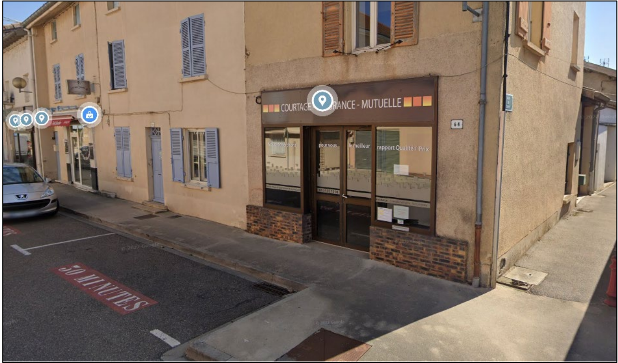
Figure 2 : Photographie du local depuis la Rue du Centre

Ledit local concerné par le présent appel à candidature est un ancien local commercial donnant sur la voie publique, acquis par la municipalité en 2022 par voie de portage foncier.