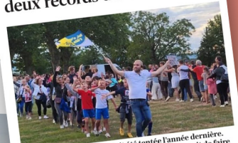
La plus grande chenille avait été tentée l'année dernière. Mais il était alors difficile de battre Lille qui venait de faire exploser le compteur.

Vous voulez rentrer dans le Livre des records ? Facile. Mardi 23 juillet, l'Esti Val de Saône vous propose non pas une, mais deux tentatives de record du monde : celui de la plus grande chenille, tentée l'année dernière et qui doit dépasser les 4 628 personnes, titre tenu par Lille, et celui, plus modeste, du plus grand rassemblement de marinières (1 052 personnes, titre tenu par Honfleur).