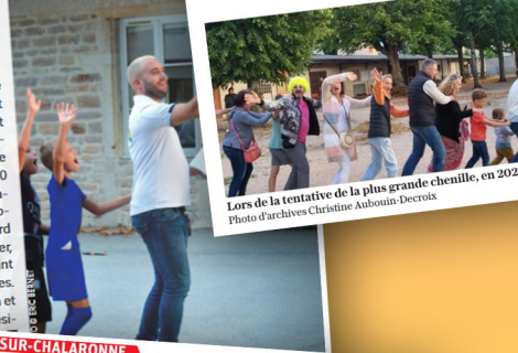
Lors de la tentative de la plus grande chenille, en 2023.

Le record mondial de la plus longue chenille n'a pas été battu en juillet dernier. Celle de la commune de Saint-Didier-sur-Chalaronne a été comptabilisée à 2 063 maillons alors que la Ville de Rouen avait réussi à réunir 3 940 personnes quelques semaines auparavant. Rappelons néanmoins qu'au moment de la décision de tenter ce record par Saint-Didier au printemps dernier, celui-ci était encore détenu par Saint-Brieuc avec environ 1 100 personnes. Ce n'est donc qu'une semi-déception et il est probable que la municipalité dési-